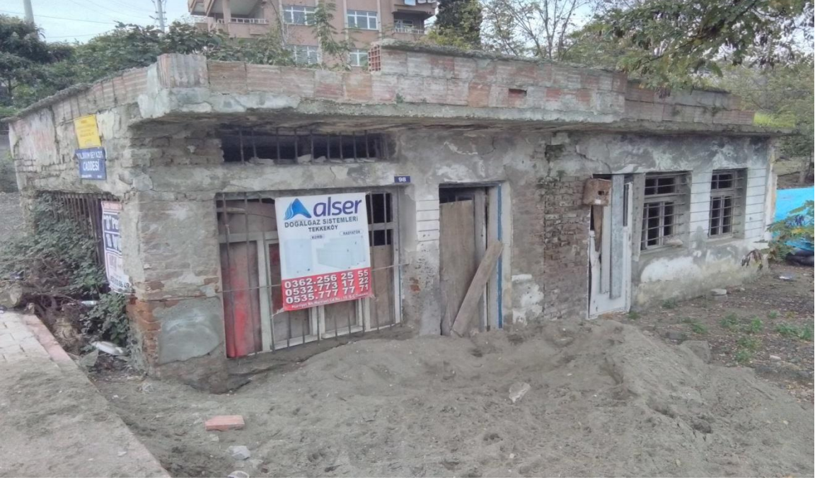
1970-1971 Eğitim Öğretim Yılında Eğitime Başlanılan 45 metrekarelik bina .